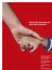
Eksempel på plakat til institutioner

Tilslutningsaftalen omfatter også en landsdækkende smileyordning. Institutioner eller afdelinger modtager en Brandparat-smiley, når minimum 10 medarbejdere har bestået Brandskolen.