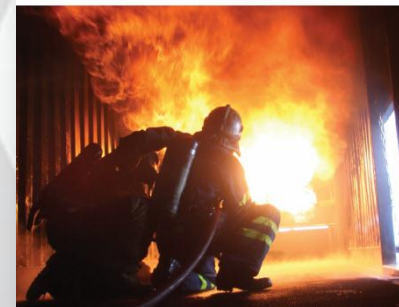
Brannøde i Norge pr 26.09